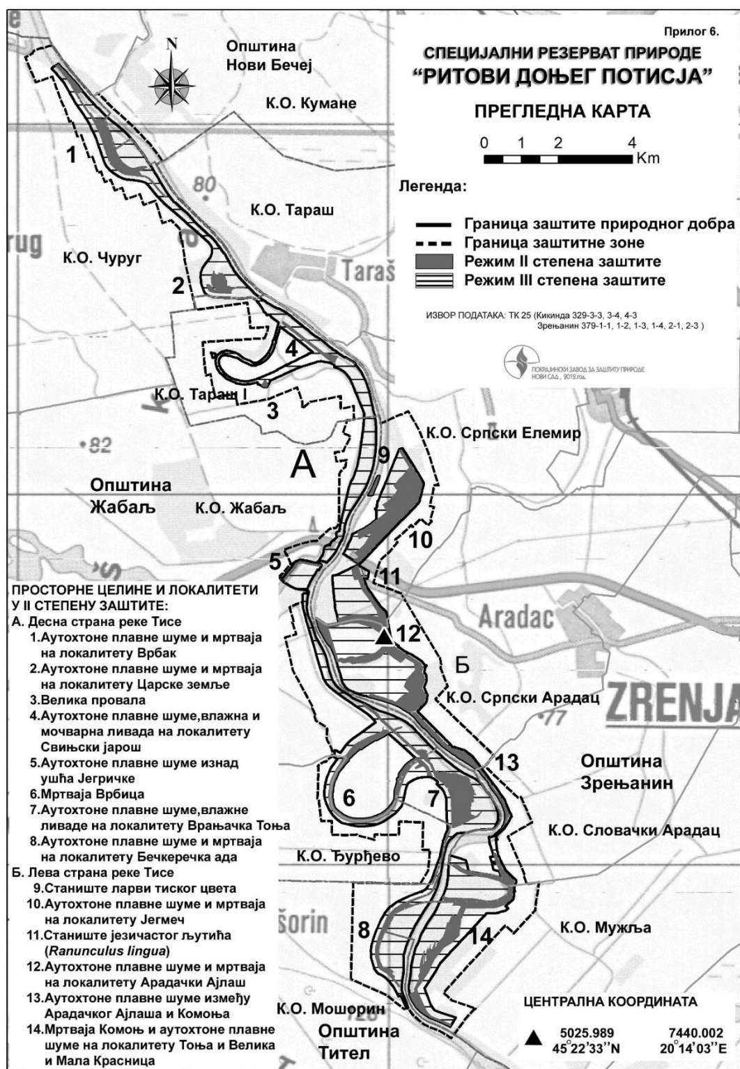
Слика 1: Специјални резерват природе „Ритови доњег Потисја“