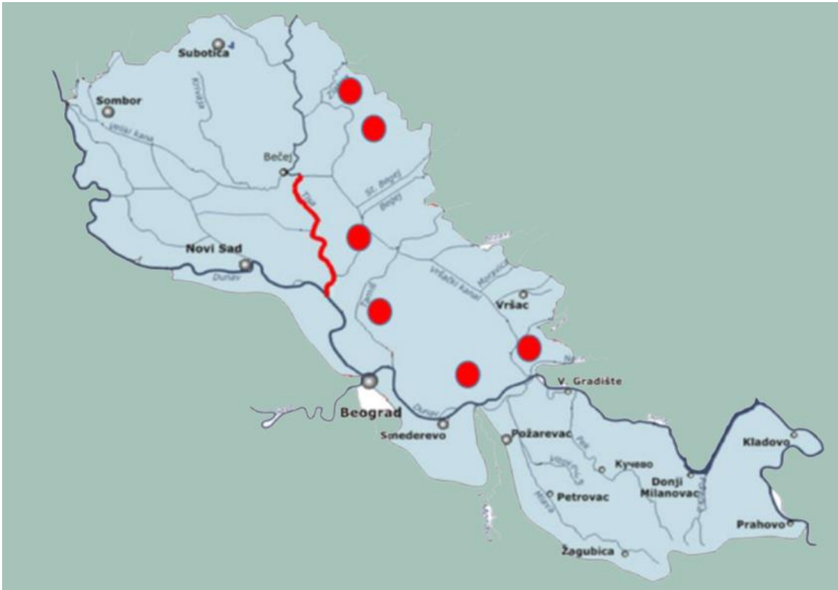
Слика 3: Делови рибарског подручја „Банат“ којима управља установа